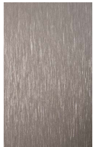
3903-GB Titanium Brushed