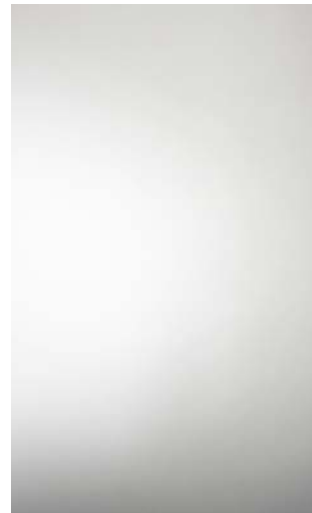
3907-HG Aluminium Gloss