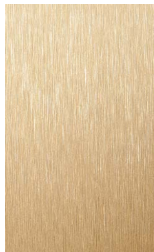
3901-GB Gold Brushed