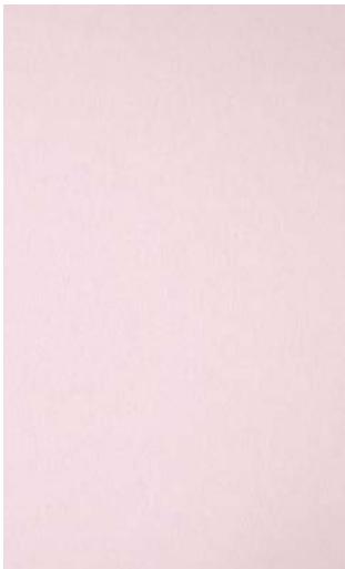
3917-FG Powder Matted