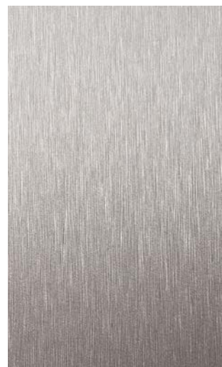
3900-GB Aluminium Brushed