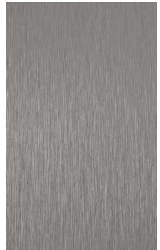
3906-TM Titanium Traceless Metal