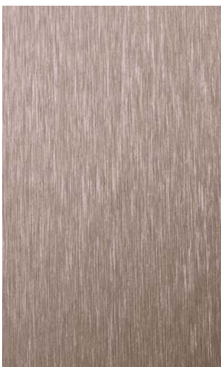
3902-GB Copper Brushed