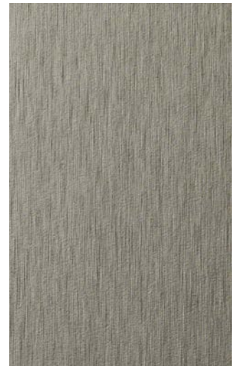
3951-TO Titanium Brushed Horizontal